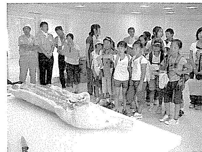
初めて見る枝肉に目を丸くする子どもたち

同ネットワークは、大学を核とする産官学の連携組織で、多摩地域の活性化のための事業を行うことを目的としている。本プロジェクトは、その一貫として多摩地区の小学3、4年生を対象に、環境の重要性をさまざまな体験を通じて知ってもらおうというもの。中央大学の細野助博